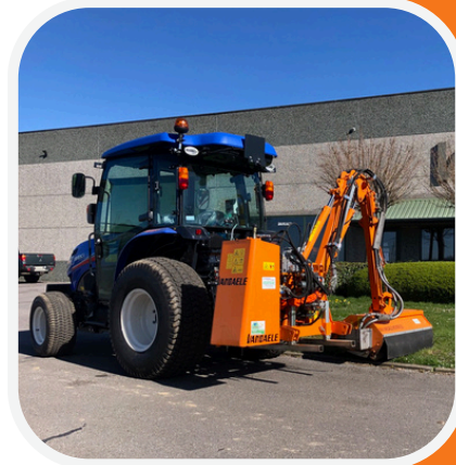
Hydraulische Sicherheitsvorrichtung bei Hindernissen