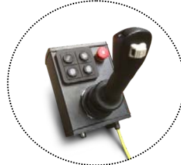
ELEKTRISCH PROPORTIONALER JOYSTICK