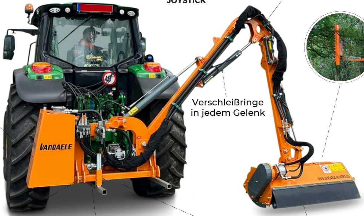
Geschraubter Tank, mineralisches oder biologisch abbaubares Öl, Filter, Ölstandsanzeige