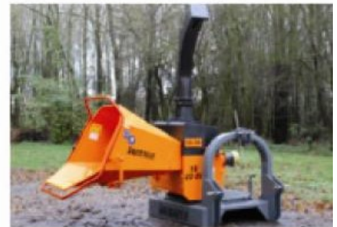
TV20-26 P ; Tractor aangedreven 2 x 90° draaibaar (optie)