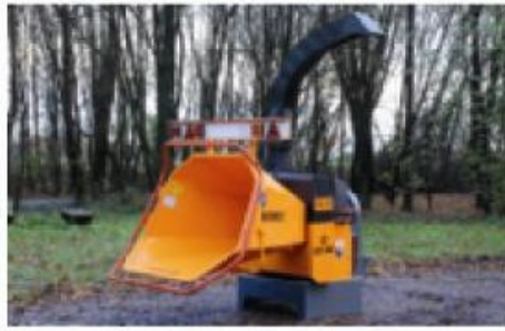
Standaard tractor aangedreven 3-puntsmachine