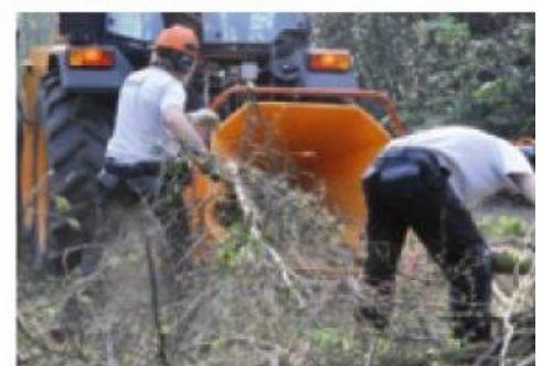
Hoge kwaliteit gekoppeld aan productiviteit