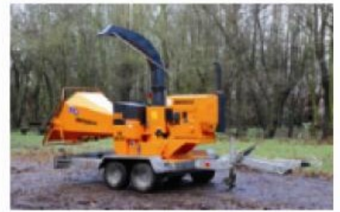
Motoraangedreven machine met onderstel snelvervoer

Groot middenklassemodel voor echte professionals. Voor het versnipperen van twijgen, takken & stammen van eender welke houtsoort tot een diameter van 200mm. Verkrijgbaar in tractor aangedreven of diesel aangedreven versie.