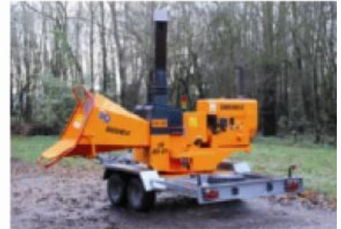
TV20-26 D ; Onderstel op tandem as 360° draaibaar (standaard uitvoering)

B : 1950mm H1: 2850mm H2: 2650mm H3: 2120mm L : 4740mm 1750kg