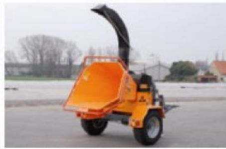
TV20-26 P ; Tractor aangedreven, wielstel traag vervoer (optie)