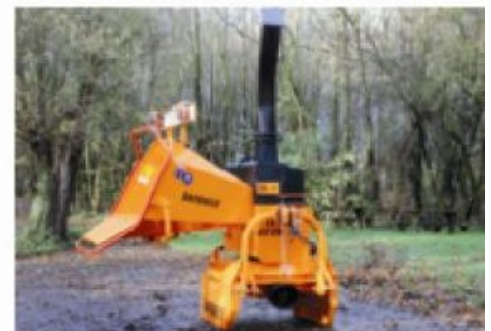
TV20-26 P ; Tractor aangedreven 270° draaibaar (optie)