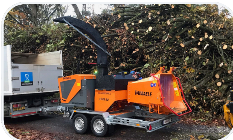
Um drehbare Ausführung auf Tandem-Fahrgestell und mit höhenverstellbarer Zugeinrichtung Erhältlich als Raupenversion mit drehbarem Aufbau