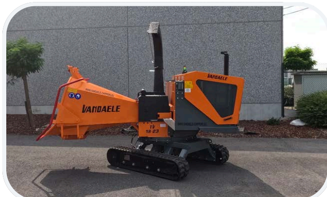
Auch als Raupenversion erhältlich, Aufbau um drehbar