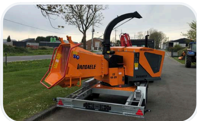
Um drehbare Ausführung auf Tandem-Fahrgestell und mit höhenverstellbarer, Zugeinrichtung