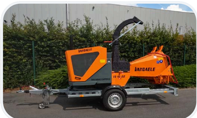
Wahlweise fester oder um drehbarer Aufbau Einachs- oder Tandem-Fahrgestell Zugeinrichtung fest oder in der Höhe verstellbar