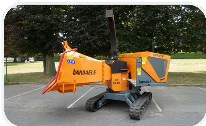
Auch als Raupenversion erhältlich, Aufbau um drehbar